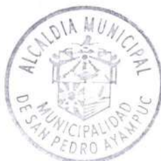
JOSE FREDY PELAEZ AVALOS Alcalde Municipal San Pedro Ayampuc, Guatemala

VIGÉSIMA QUINTA: ACEPTACIÓN: Ambos comparecientes, aceptamos el contenido del presente, y advertidos los otorgantes de los efectos legales del presente contrato y que leímos lo escrito y bien enterados de su contenido, objeto, validez y demás efectos legales, lo ratificamos, aceptamos y firmamos en once hojas de papel bond tamaño oficio con membrete de la Municipalidad de San Pedro Ayampuc, Departamento de Guatemala, las cuales están impresas en sus lados anverso y reverso.